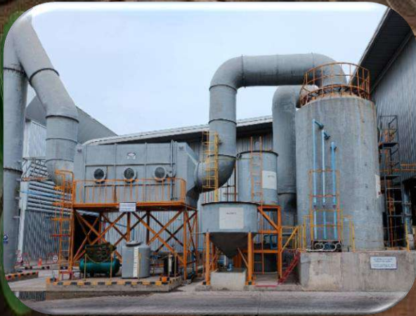
ระบบเวสคัปเบอร์ 2