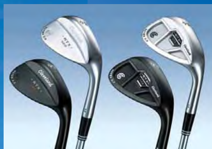
Cleveland 588 RTX 2.0