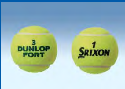
DUNLOP FORT / SRIXON

ラブ「ゼクシオ ナイン」は順調に販売を伸ばし、当期もゴルフクラブ、ゴルフボールにおいてシェアNo.1 ※2 を確保しましたが、ゴルフウェアでは当期よりデサント社とのライセンスビジネスに切り替えたため減収となったことなどにより、国内ゴルフ用品全体としては、売上収益は前期を下回りました。