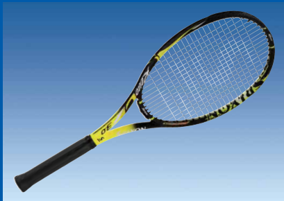
SRIXON REVO CV3.0

ショートゲームに於ける卓越した独自技術を、 すべてのゴルファーに惜しみなく捧げるブランド